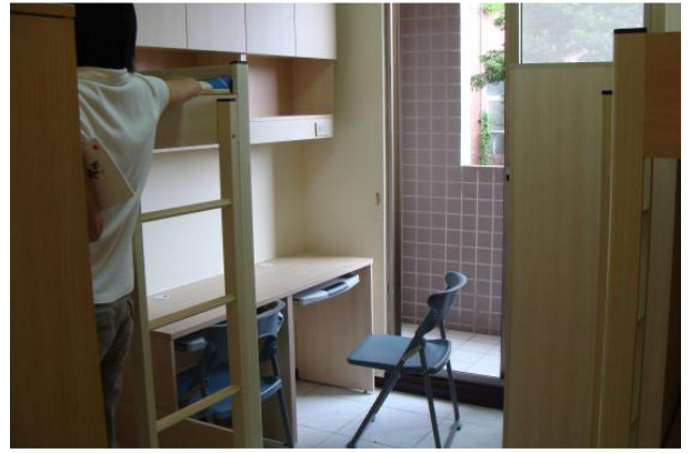
大群館寢室內部設施