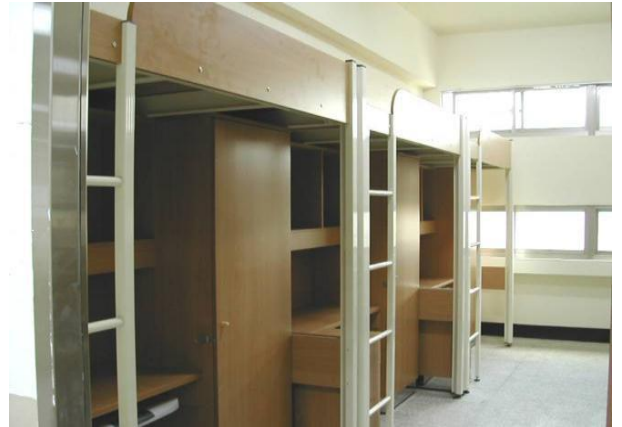
大雅館寢室內部設施